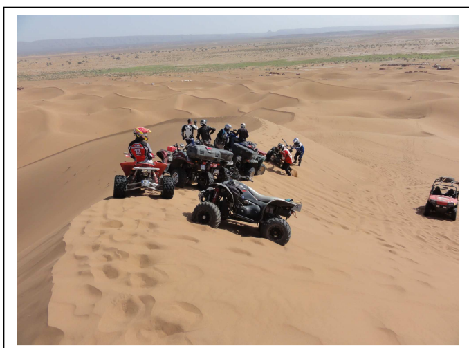
ATTENTION SENSATION GARANTIE