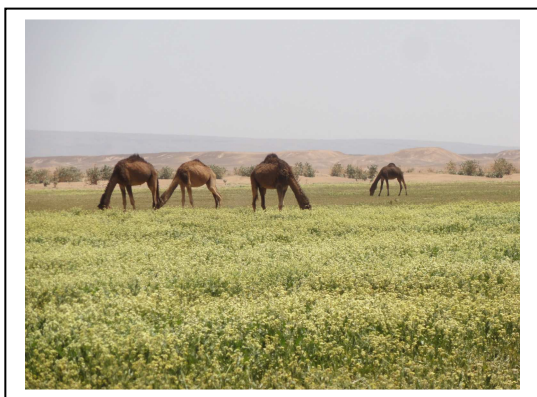
Le bouviac ,grande soirée

Dunes et désert immaculés, feu de bois, tentes berbères appropriées et lieux de vie inoubliés, voûtes célestes illuminées et bivouacs inaccoutumés.