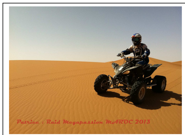
A l'assaut des grandes Dunes